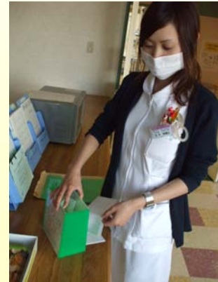
<アンケート回収風景>

各階デイルーム及び1階ロビーに設置されている投書箱には定期的に委員会メンバーが巡回し、皆様にご記入頂いたアンケートや寄せられた投書を責任をもって回収させて頂いております。