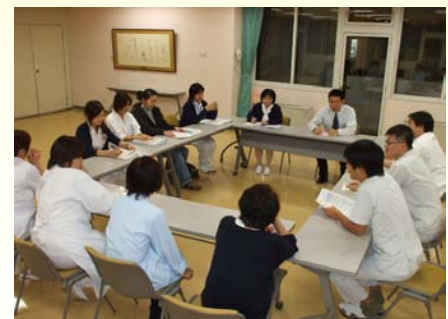
<委員会協議の様子>

この会議において、皆様から寄せられたご意見全てをメンバーにて目を通し、問題点の抽出や改善策の検討のほか、各部署での対処が適切かどうかなどの検証を行っております。