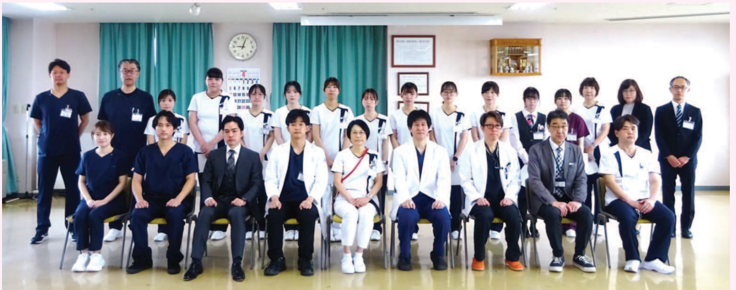
帯広第一病院・なかよし保育所