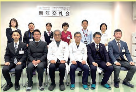
介護老人保健施設とかち ケアマネジメントセンターほほえみ ヘルパーステーションほほえみ 音更町地域包括支援センターほほえみ